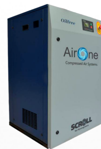
COMPRESOR DE AIRE MEDICINAL SILENCIOSO MONOFÁSICO 220V

FABRICACIÓN - COMERCIALIZACIÓN - EXPORTACIÓN INSTITUTO DE SALUD PUBLICA DE CHILE ISP REGISTRO EDM 630-2022