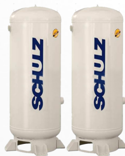
ESTANQUES ACUMULADORES DE AIRE